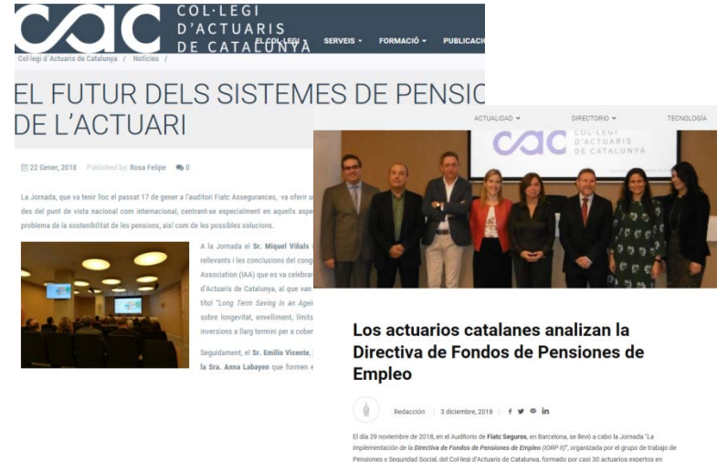
Los actuarios catalanes analizan la Directiva de Fondos de Pensiones de Empleo